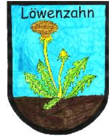
Kindergruppe „Löwenzahn“ in Leupoldsdorf vollstationär, 6 Plätze