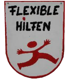
Flexible Hilfen SPFH, Betreutes Wohnen (intern, extern), Begleiteter Umgang, Systemische Beratung (Familie, Kinder- u. Jugdl.)