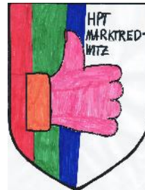
HPT MAK teilstationär 9 Plätze