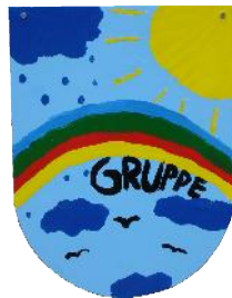
Kindergruppe "Regenbogen" vollstationär, 8 Plätze