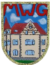
Mädchenwohngruppe "Villa" vollstationär, 9 Plätze Inobhutnahme, 1 Platz