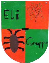
Kindergruppe "Elisabeth" vollstationär, 9 Plätze Inobhutnahme, 2 Plätze