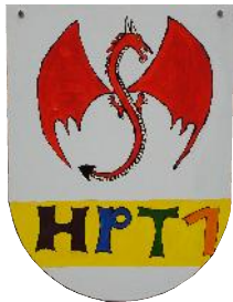
HPT 1 teilstationär 9 Plätze