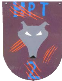
HPT 2 teilstationär 9 Plätze