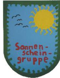
Kindergruppe "Sonnenschein" vollstationär, 9 Plätze