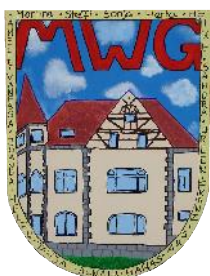
Mädchenwohngruppe "Villa" vollstationär, 9 Plätze Inobhutnahme, 1 Platz