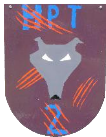
HPT 2 teilstationär 9 Plätze