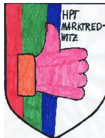
HPT MAK teilstationär 9 Plätze