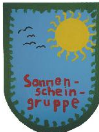
Kindergruppe "Sonnenschein" vollstationär, 9 Plätze