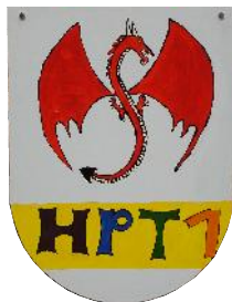
HPT 1 teilstationär 9 Plätze