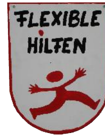
Flexible Hilfen SPFH, Betreutes Wohnen (intern, extern), Begleiteter Umgang, Systemische Beratung (Familie, Kinder- u. Jugdl.)