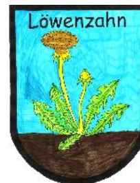
Kindergruppe „Löwenzahn“ in Leupoldsdorf vollstationär, 6 Plätze