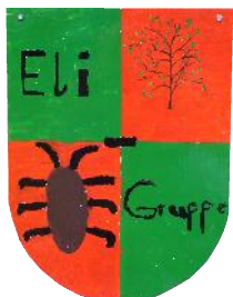
Kindergruppe "Elisabeth" vollstationär, 9 Plätze Inobhutnahme, 2 Plätze