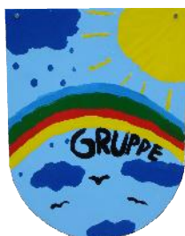
Kindergruppe "Regenbogen" vollstationär, 8 Plätze